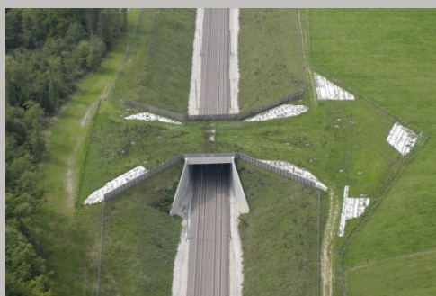
Exemple de passage grande faune sur la LGV Est

Ces échanges ont très largement nourri la réflexion sur le projet et ont fait émerger des variantes au tracé test sur les 2/3 du linéaire que compte le projet. Plusieurs variantes peuvent exister. Au total, 240 km du projet ont ainsi été étudiés.