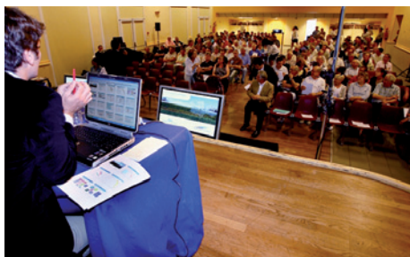
Réunion publique à Lussac-les-Châteaux

Cette deuxième étape sera menée, tout comme la première, en concertation étroite avec les acteurs concernés : élus locaux, collectivités locales, associations, représentants du monde économique, agricole, etc. Le public continuera d'être informé et sollicité. Au cours de l'étape 1, ce sont au total près d'une cinquantaine de réunions, dont 3 réunions publiques, qui ont été organisées par Réseau Ferré de France.