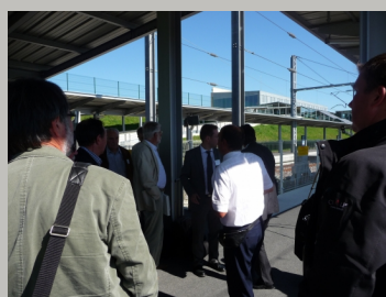
21 septembre 2010 visite sur la LGV Est Européenne

Les 21 et 22 septembre dernier, les élus locaux directement concernés par le tracé de la LGV Poitiers-Limoges se sont rendus sur la LGV Est européenne. Accompagnés par RFF, ils ont pu appréhender toutes les caractéristiques d'une infrastructure de ce type : emprise de la voie, aménagements paysagers, protection acoustique, etc. Cette visite a également été l'occasion pour les élus d'échanges fructueux avec leurs homologues Champenois.